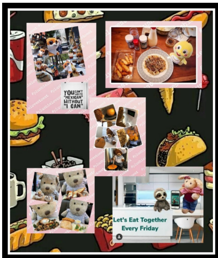
Победители июня, июля, августа и сентября: @ukibear , @alexadearcelona , @dino.vipkid , @mynameis.first

Мне приятно проводить это кулинарное шоу вместе с @mallorcansloth но, как неустанно напоминают нам @dreamy.doris мы с нетерпением ждем следующего года: «Я нашел этот хештег, когда искал простые и быстрые рецепты, но теперь я обожаю #plushielovestoeat! » Мы приглашаем вас. В меню – культурное многообразие. Приятного аппетита! Заходите к нам на #plushielovestoeat .